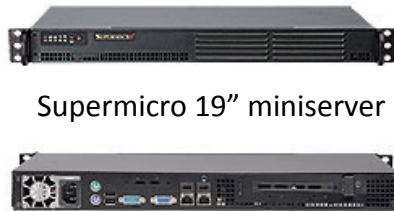
Supermicro 19" miniserver